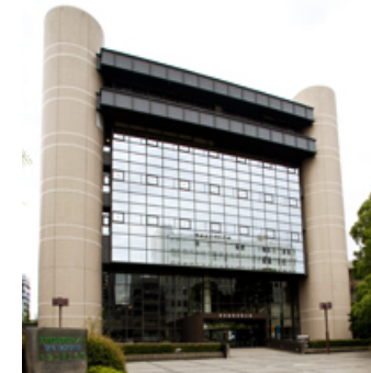
東京都立産業貿易センター浜松町館