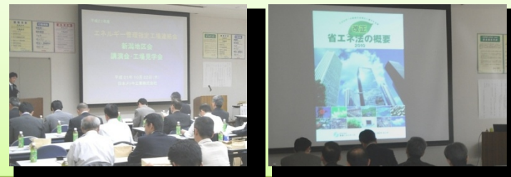
「講演会」、「事例発表会」の様子