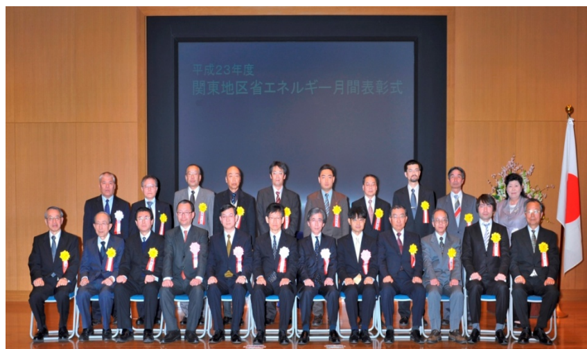
エネルギー管理功績者(16名)